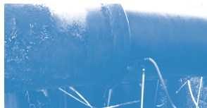
Flagrante de ligações clandestinas em adutora

Na figura a seguir, pode ser observado o furto de água tratada através de ligações clandestinas precárias: fato comum em nossa rede de distribuição adutoras que comprometem a qualidade da água dos cidadãos que mantêm seu abastecimento regularizado.